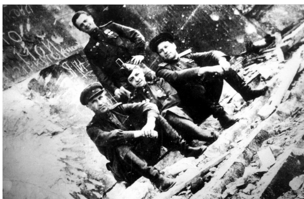
У стен Рейхстага, 1945 г.