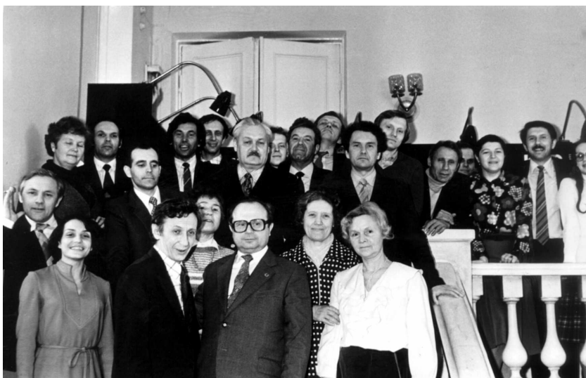
Среди учеников и последователей, 1982 г.